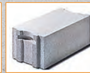
... als auch Porenbeton, Kalksandstein und viele weitere Baumaterialien