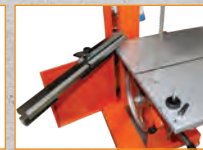
Durch einfachen und direkten Zugang lässt sich das Sägeblatt schnell wechseln