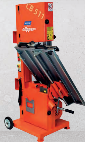
Abmessung mit eingeklapptem Schneidisch (Transportstellung) 1050 x 900 x 1840mm