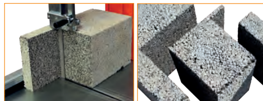
Präzisionsschnitte für alle Anwendungen