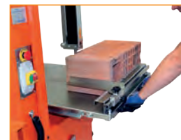
Sicher in der Anwendung