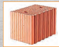
Ideal sowohl für Hochlochziegel ...